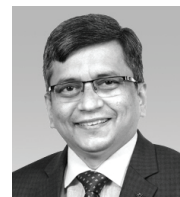
G N Ramaswami Assurance Chennai