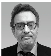
DK Giridharan Assurance Chennai